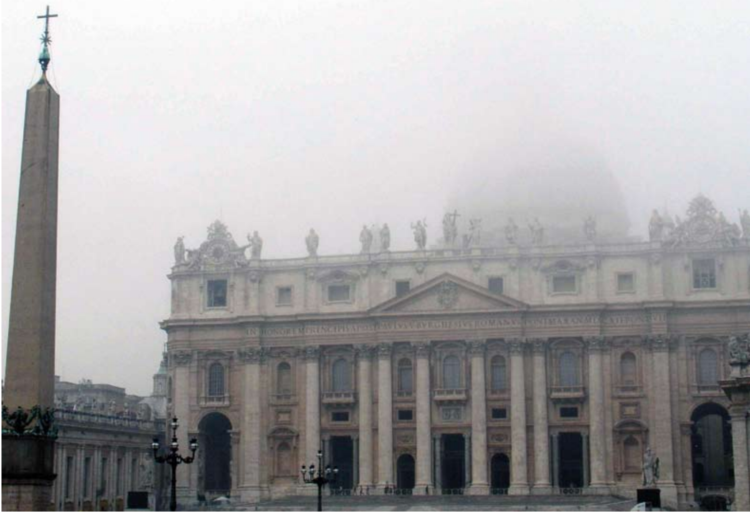
Der Petersdom im Nebel.

dem ein kleines Monument errichtet worden ist. Es gibt soundsoviele Gräber, die sich dicht an dicht um dieses Grab drängen. Was man nicht gefunden hat, ist ein intaktes Grab mit einer kleinen Bronzeinschrift: HIER RUHT PETRUS. Das hat man nicht gefunden.